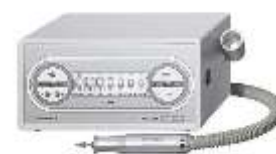
Brusni aparat TEC A 500 sa usisom ili TEC A 250 bez usisa-garancija 2 god.