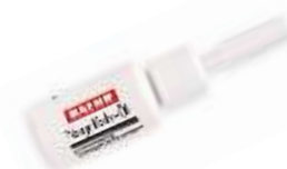
Ulje za kožicu 7 ml.