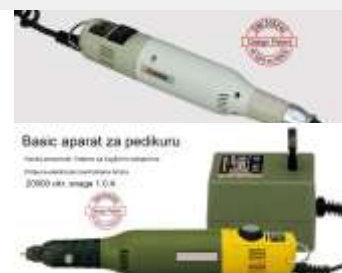
Basic aparat za brušenje