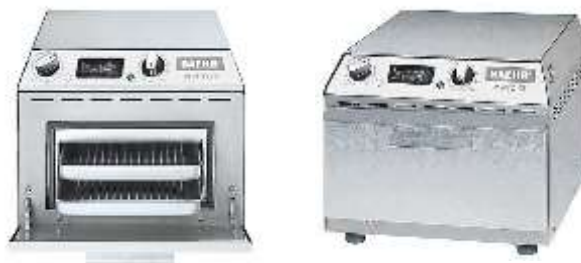
Sterilizator Baehr 75 T